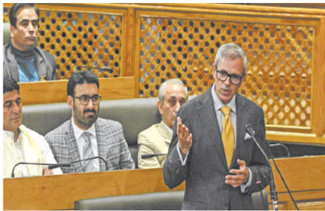
संवैधानिक पहलू पर केंद्र और राज्य सरकार किस तरह तालमेल बिठा पाती हैं, देखने की बात है। इस