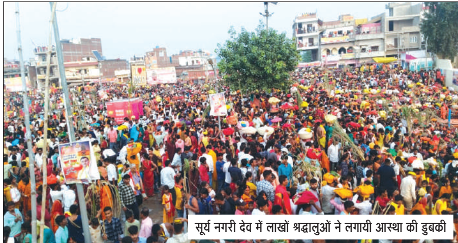
सूर्य नगरी देव में लाखों श्रद्धालुओं ने लगायी आस्था की डुबकी

नवबिहार टाइम्स ब्यूरो औरंगाबाद। उदीयमान सूर्य को अर्घ्य देने के साथ ही चार दिवसीय लोक आस्था का महापर्व छठ का समापन हो गया। इस मौके पर औरंगाबाद जिले के ऐतिहासिक, धार्मिक और पौराणिक स्थल सूर्य नगरी देव में बिहार-झारखंड के अलावा पूरे भारत से लगभग 10 लाख श्रद्धालुओं ने भगवान भास्कर को अर्घ्य देकर आस्था की डुबकी लगाई। छठ पूजा को लेकर देव में नहाय खाय से ही छठव्रतियों और श्रद्धालुओं का तांता लगा हुआ था। आज सुबह से ही अर्घ्य देने के बाद अर्घ्य आकर्षक ढंग से सजाये गये देव के त्रेतायुगीन सूर्य मंदिर में महिला-पुरुष श्रद्धालुओं की लंबी कतार लगी रही और लोग बारी-बारी से भगवान भास्कर का दर्शन एवं पूजन-अर्चन कर रहे थे। देव का पूरा इलाका छठी मैया के भक्तिपूर्ण और कर्णप्रिय गीतों से गुंजायमान हो गया। देव छठ मेला में आने वाले श्रद्धालुओं और छठव्रतियों की सुविधा के लिए औरंगाबाद जिला प्रशासन की ओर से बिजली, पानी, स्वास्थ्य, सुरक्षा,